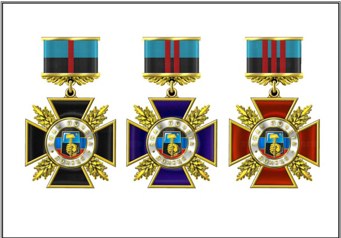
Рисунок Нагрудного знака округа

Приложение 5 к Положению о Нагрудном знаке муниципального образования городской округ Донецк Донецкой Народной Республики «Знак почета» I, II, III степеней (пункт 4.14)